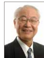
昭和12年旭川生まれ。北海道大学医学部卒。現在、医療法人敬生会豊岡中央病院会長。著書に「真っ当な日本人の育て方」(新潮選書)ほか多数。

私たちの同胞が北朝鮮の国家的犯罪によって拉致されてから、はや四十年が過ぎようとしています。日本会議会員の皆さんなら誰でも常にもその動向を気づかい、一日も早い全員の帰還を願っておられるでしょうが、我が国のメディアは何か大きな動きがあった時にしか報じなくなりました。