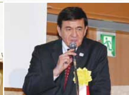
ジョークを交えたケント氏の講演に、会場からは何度も拍手が!