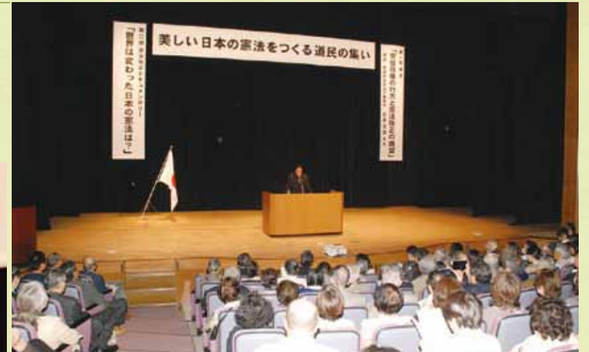
「安倍首相の決意」は本物と語る石橋氏 高まりを見せた「改憲機運」