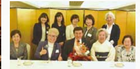
「日本女性の会北海道」の役員・理事との懇談