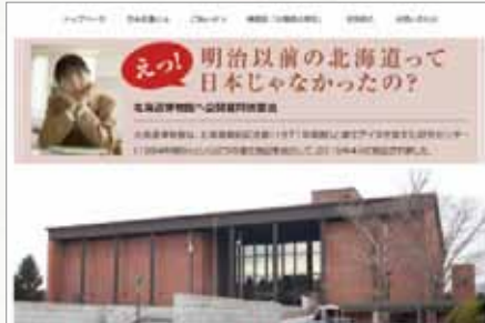
12月12日 日本会議北海道本部ホームページ 博物館問題公開質問状掲載 詳しくは10P参照