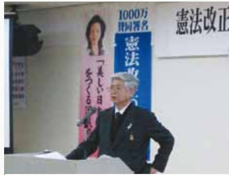
12月17日 憲法改正を考える恵庭市民の集い 会場:恵庭市民会館 講師:武谷専務理事