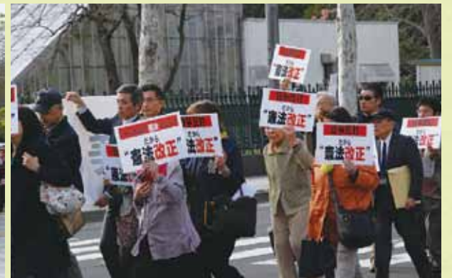
憲法改正を訴えるプラカードや横断幕を抱えてパレード行進